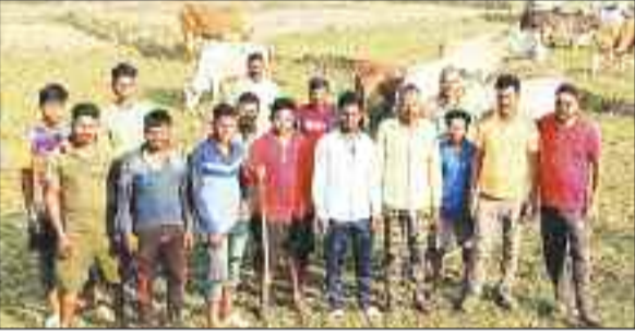
मवेशियों के साथ दल के सदस्य।