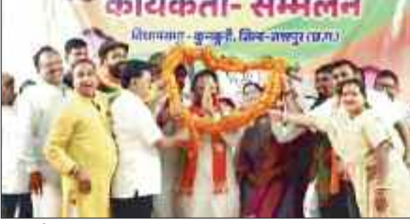
मुख्यमंत्री का स्वागत करते भाजपाई।

आसन्न लोकसभा चुनाव में जनता कांग्रेस को कहां और किस हाल में बैठाएगी यह हम सब देखेंगे। प्रधानमंत्री नरेंद्र मोदी को लेकर