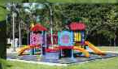
थिल्ड्रन्स प्ले एरिया