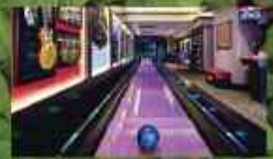
बोलिंग एले गेम

मारुती 7 वंडर सिटी | संपर्क : 6262110999, 7389900999